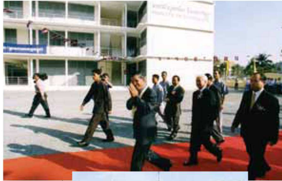
La nouvelle Faculté de Pharmacie de Phnom Penh

Soutenue par tous ceux qui voudront bien l'accompagner dans son action, je ne doute pas qu'elle saura, pour le bien de tous, relever d'importants défis en permettant aux populations de bénéficier de médicaments et de soins de qualité.