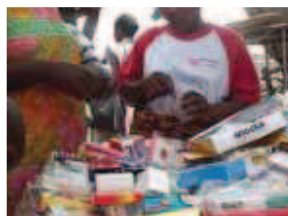
Vente de médicaments contrefaits sur le marché de Cotonou.

Cette Centrale a pour mission d'approvisionner en médicaments essentiels sous nom générique l'ensemble des formations sanitaires du secteur public et du secteur privé à but non lucratif. L'objectif de cette action est d'améliorer la disponibilité du médicament essentiel en agissant principalement sur la réduction des ruptures de stock et des péremptions, ce, pour améliorer la satisfaction du client.