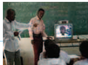
Session de sensibilisation dans un collège de Cotonou

Au-delà de ces actions, la Fondation Pierre Fabre, en 2005, met en place des sessions d'informations et de sensibilisation auprès des enfants des collèges (de la sixième à la quatrième) à partir d'un documentaire privilégiant l'interactivité entre les jeunes et un animateur professionnel présent dans la salle de classe.